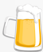
Bière 25 cl à 5°